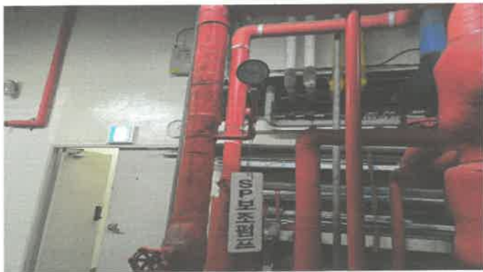
기계실 스프링클러 보조펌프 압력계 교체.