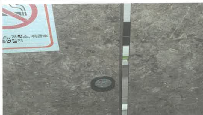
수영장 내 화장실 문턱 보수.