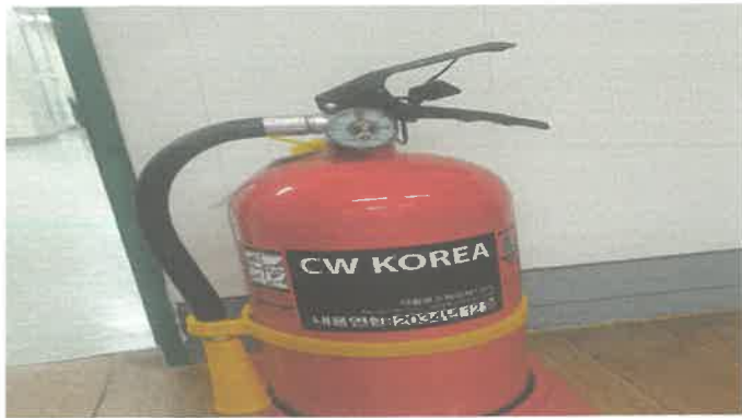
아마테우스실 소화기 불량·교체.