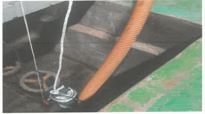
저수조 드레인벨브쪽 이송주름배관 교체.