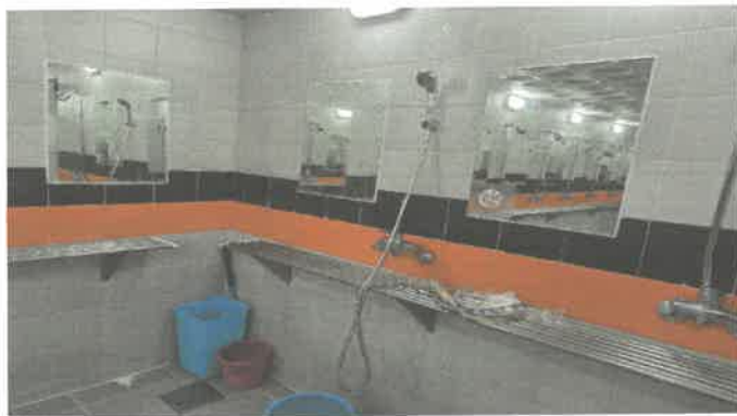
수영장 여자샤워실 샤워기1EA 교체.