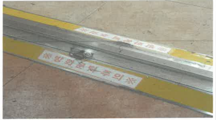
방화문 문턱 용접부분탈락·재용접.